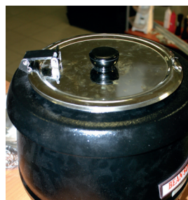
4. Zamknąć pokrywę