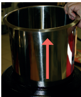
1. Wyjąć pojemnik na zupę