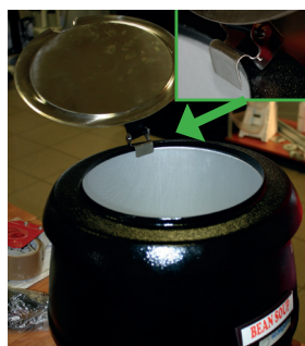
2. Nałożyć zaczep zawiasu pokrywy na rant urządzenia